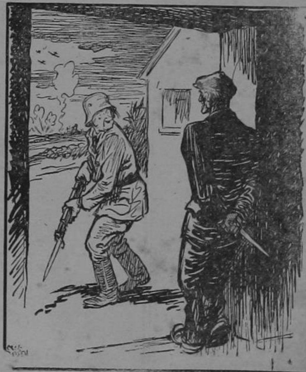
"Ahora sí que estamos listos para cooperar..."

—Entonces? —Me explico. En mi provincia prefieren que se queden en San José con tal de que no vuelvan más por allá.