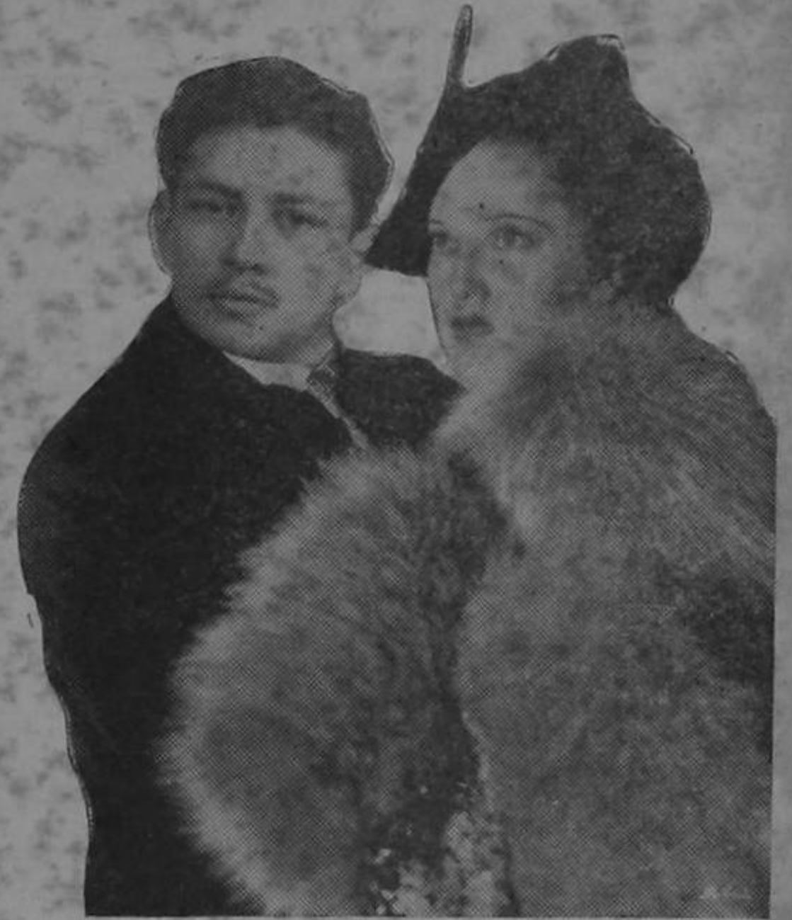
El fotógrafo de La Semana Cómica sorprendió al señor Secretario de Estado en momentos en que se dedicaba al "Registro"

Leemos en los periódicos que el señor Secretario de Gobernación está empeñado en reorganizar el Registro Cívico.